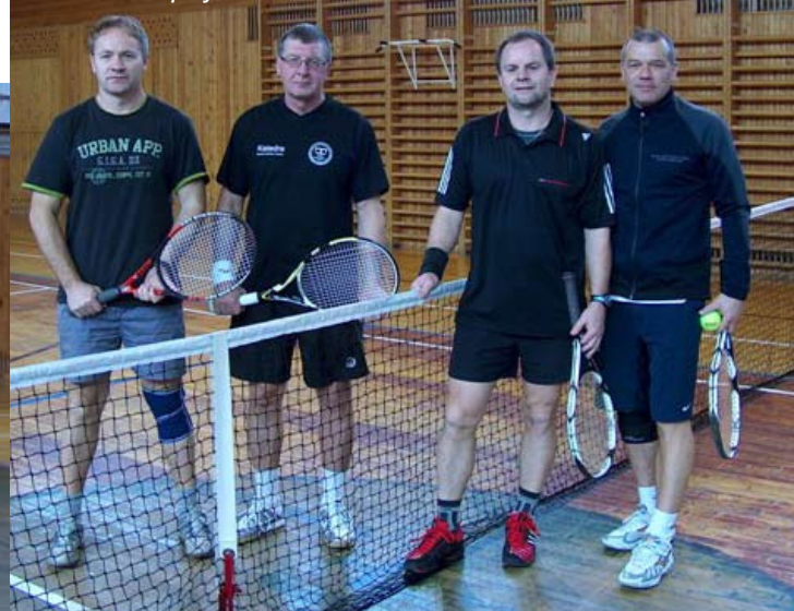
Chvosta - Hanák