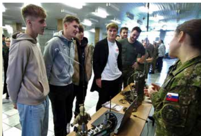
text, foto: -sz-

Novinkou aktuálneho DOD bola prehliadka zrekonštruovaných internátov a 50 m bazéna, prehliadka priestorov telovýchovy i parku techniky, letecký trénažér, ktorý obsluhovali kadeti a zároveň študenti Leteckej fakulty TUKE, ukážky kolesovej techniky typu TATRA, či možnosť získať informácie od študentov Univerzity obrany Brno v odbore chemik a vojenský lekár.