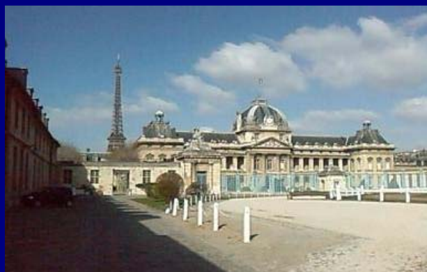
Vojenská škola v centre Paríža