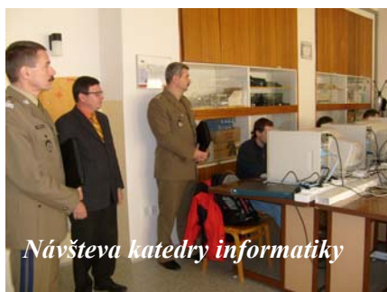
Návšteva katedry informatiky