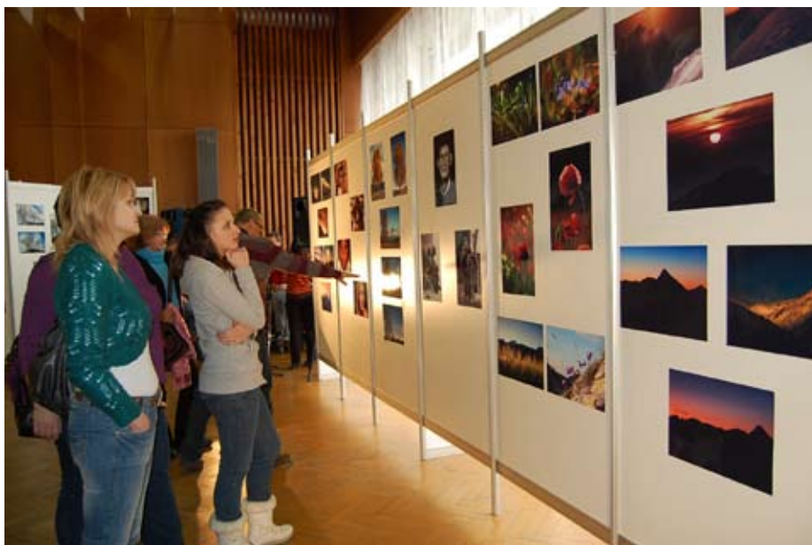
Výstava trvala v Posádkovom klube Liptovský Mikuláš v areáli Akadémie ozbrojených síl od 14. do 28. februára tohto roku.